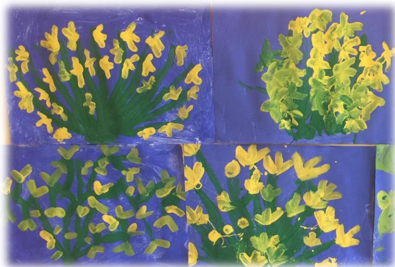
Radovi djece vrtića Bubamara

Po povratku kući dajte djetetu kolaž, tempere ili flomaster, neka naslika/ nacрта brnistru.