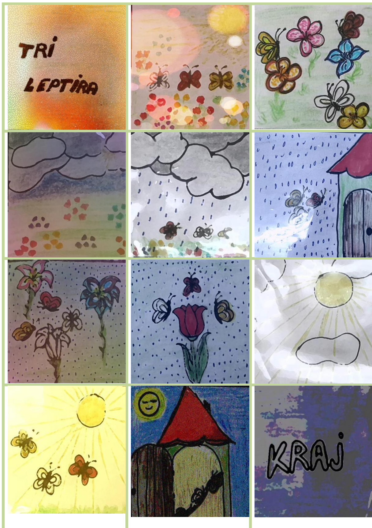
Ilustracija: Mila Cvrlje